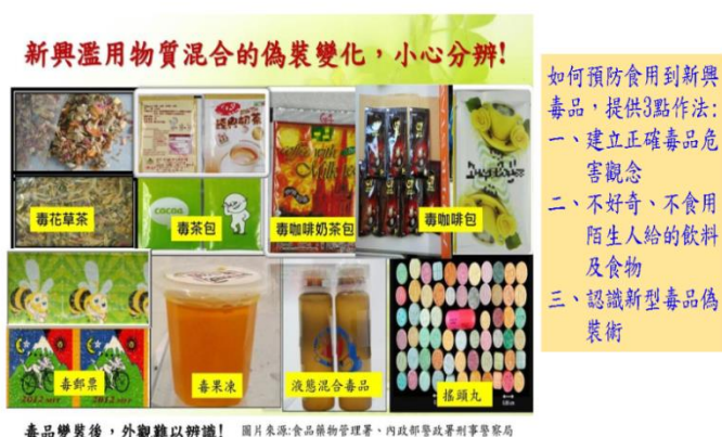
新興毒品樣態及預防