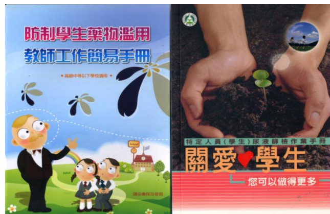
防制藥物濫用手冊