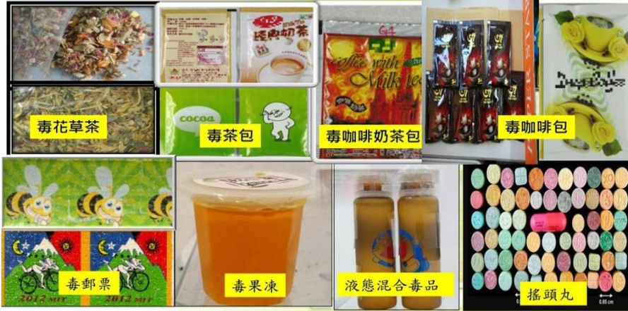
毒品變裝後，外觀難以辨識！

如何預防食用到新興毒品，提供3點作法： 一、建立正確毒品危害觀念 二、不好奇、不食用陌生人給的飲料及食物 三、認識新型毒品偽裝術