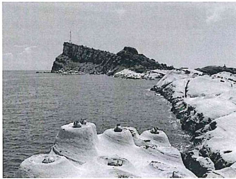
圖 2：台灣地景保育網任選一張地質公園的照片